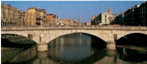
El Pont de Pedra és un mirador excel·lent sobre les cases de l'Onyar