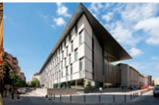
9 ANTIC HOSPITAL DE SANTA CATERINA → P. 80