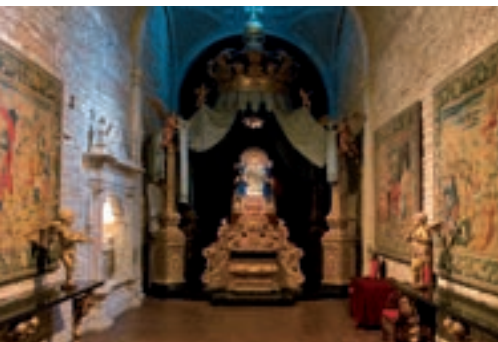
1 MUSEU DE LA CATEDRAL → P. 61