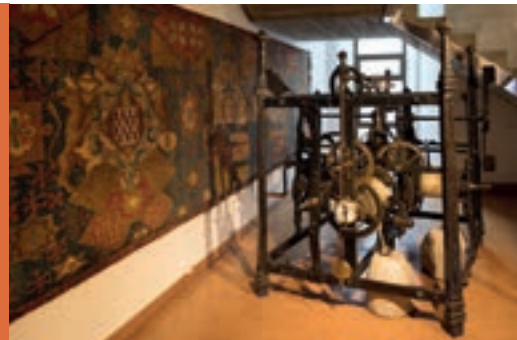
5 MUSEU D'HISTÒRIA DE GIRONA → P. 72