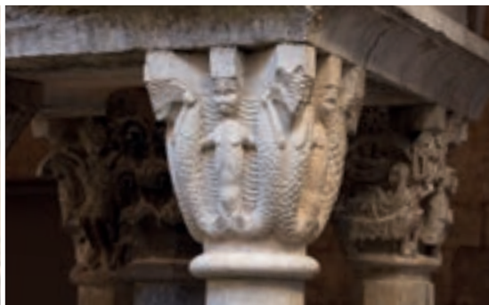
2 MUSEU D'ARQUEOLOGIA SANT PERE DE GALLIGANTS → P. 64