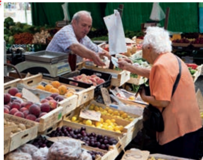
Mercat del Lleó

L'estrella autòctona és el xuixo farcit de crema i cobert de sucre, suposadament sorgit a primers del segle XX a partir d'un pastís d'origen francès. Però un cop d'ull als aparadors de les pastisseries gironines serveix per constatar que els llaminers tindran feina a pair tot el que se'ls ofereix.