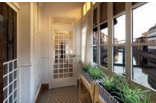
7 LA CASA MASÓ → P. 78