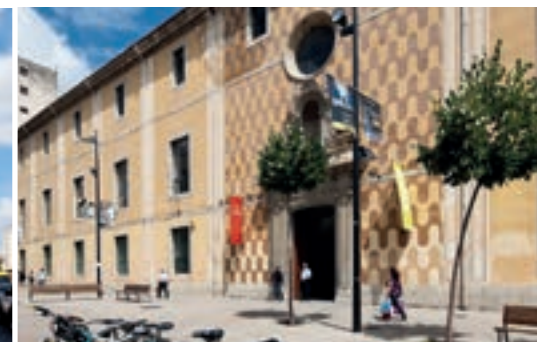
10 CENTRE CULTURAL DE LA MERCÈ I CASA DE CULTURA → P. 81