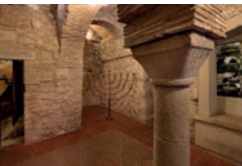
3 MUSEU D'HISTÒRIA DELS JUEUS → P. 68