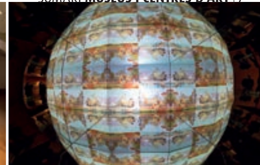
6 MUSEU DEL CINEMA → P. 75