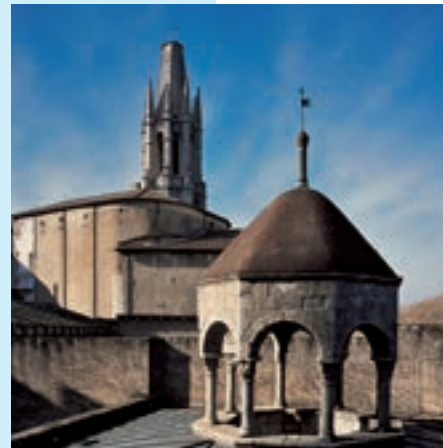
La llanterna dels Banys Àrabs permet il·luminar l'interior

El frigidarium és una gran sala de banys freds amb voltes de pedra tosca i latrines. Al caldarium hom podia gaudir d'un reconfortant bany calent, mentre que el tepidarium era la sala dels banys tebis de vapor i els massatges. Un sistema integrat de conducció d'aigua calenta, que partia d'una zona amb forn, calderes i cisternes, desguassava a la claveguera i garantia el perfecte funcionament d'aquest establiment. Deixà d'exercir la seva funció al segle XVI. El 1929 va passar a mans públiques i va ser restaurat pels prestigiosos arquitectes Rafael Masó i Emili Blanc.