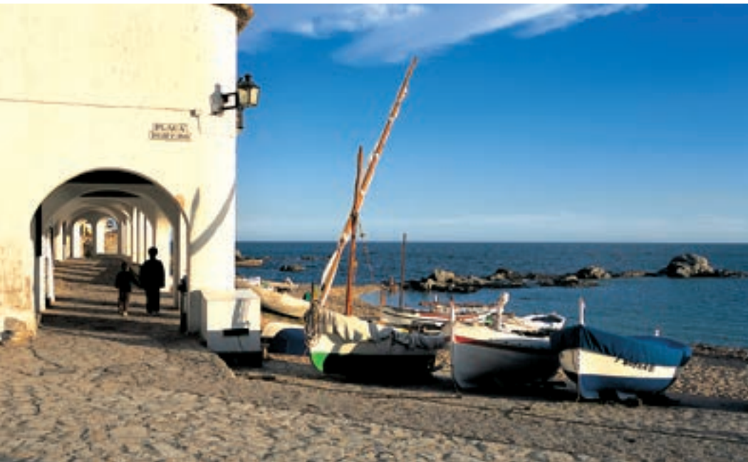
Plaça de Port Bo, Calella de Palafrugell