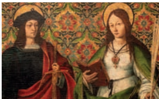
4 MUSEU D'ART DE GIRONA → P. 70